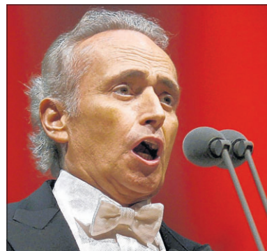
José Carreras in vol ornaat.